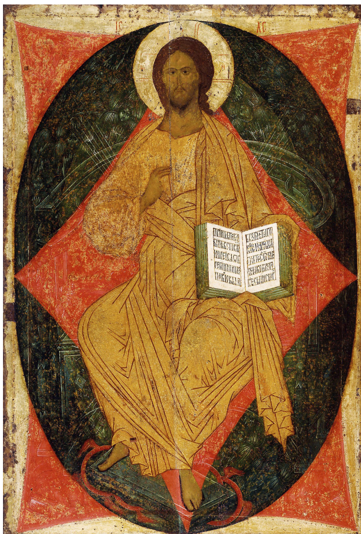
Это обеспечивает Православный приход Святой Иннокентий, Тарзана Калифорния

Кондак священномученика Харалампия, поемый на молебне – глас 6. Подобен: Предстательство христиан: Яко мученик и исповедник цвет,/ двойным венцем Христос тя увенча,/ возвеличив безчисленными чудесы на земли,/ но яко благодать Господню являя нам, / верно к тебе прибегающим, / даруй мир, помози в напастех и лютых бедах,/ святейший Харалампие.